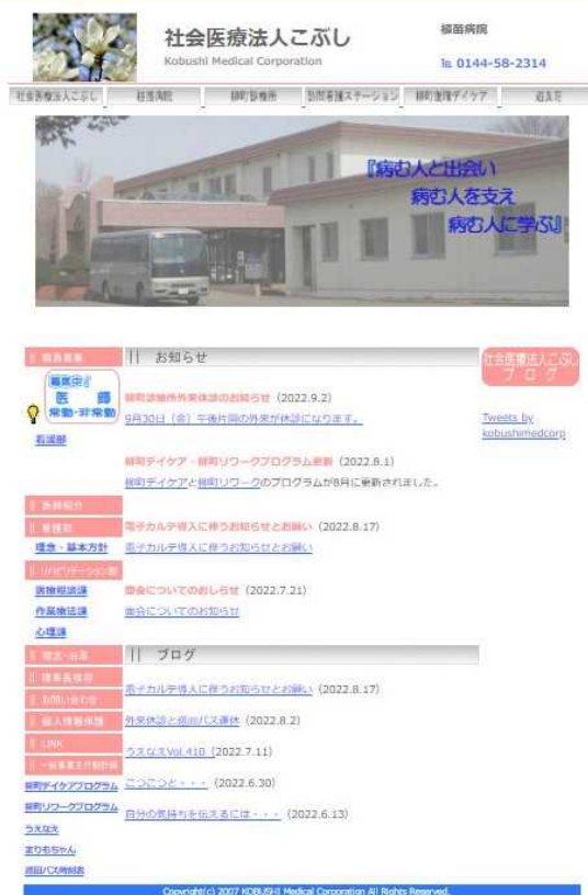
現在のホームページ

今回のリニューアルでは、より社会医療法人こぶしとしての情報を発信するホームページへと形を変えています。まだ制作途中の部分があり、詳細をお知らせする事は出来ませんが、画面も使いやすいように改良を加え、情報が得やすいよう工夫を凝らしました。今後は、建設中の新病院の情報など、法人が今どのような医療を目指しているのか、どのような活動を行っているのかを、利用される方やご家族、さらには地域の方々にも発信でき、親しまれるホームページになるよう、これからも日々頭を悩ませながら、内容を充実させていきたいと考えています。また、ブログやTwitter、広報『うえなえ』それぞれが持つ役割を使い分け、その目的と意義・内容を考えながら広報活動に取り組んでいきたいと思っております。