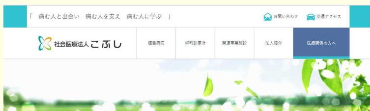
リニューアル後トップページの一部

2001年の開設当初は、外来担当医師の変更や休診の情報を中心に各部署の紹介などを行っていましたが、その後広報『うえなえ』の掲載、医師をはじめとした職員募集などのページが加えられていきました。しかし、殆どのページでは更新がなかに行われていなかったため、この状況を打破すべく2006年に広報戦略の一環としてホームページ刷新チームが結成され、2007年2月、読みやすく、使いやすいホームページとして一度目のリニューアルがされました。それまでは、植苗病院の情報を中心に作られていましたが、サテライトクリニックなどの記載を増やし、利用者の方達が必要としている情報が得られるように作り替えられ、病院中心のホームページから法人全体のホームページへと形を変えました。更に、色彩を鮮やかにして、写真などの掲載も増やし、視覚的な工夫を行って、見た目の印象も改善も行われ、現在のホームページが形作られました。