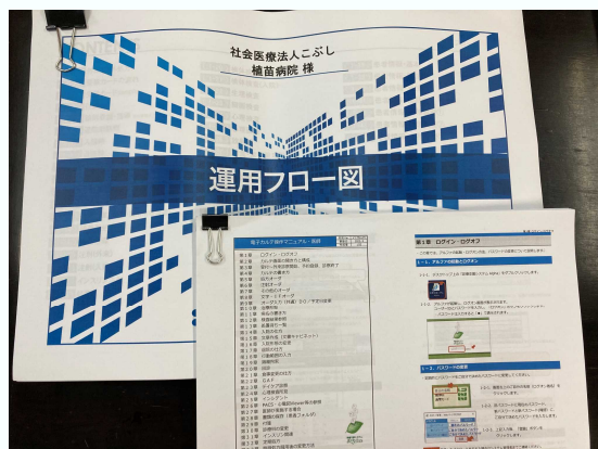
電子カルテ運用フロー図とマニュアル

現在植苗病院では新病院への移転を前に、まずは電子カルテを導入するということでその準備が進んでいます。9月からの本稼働に向けての取り組みを報告します。